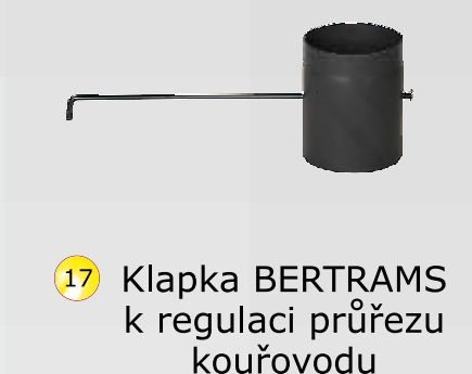
17 Klapka BERTRAMS k regulaci průřezu kouřovodu