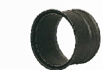
20 Zděň BERTRAMS