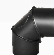
19 Koleno nastavitelné BERTRAMS 3-segmentové 90°